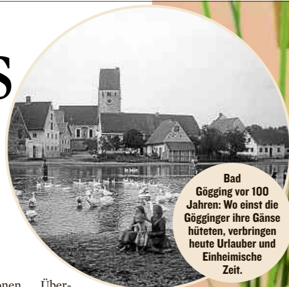
Bad Gögging vor 100 Jahren: Wo einst die Gögginger ihre Gänse hüteten, verbringen heute Urlauber und Einheimische Zeit.

Infos: www.bad-goegging.de oder tourismus@bad-goegging.de