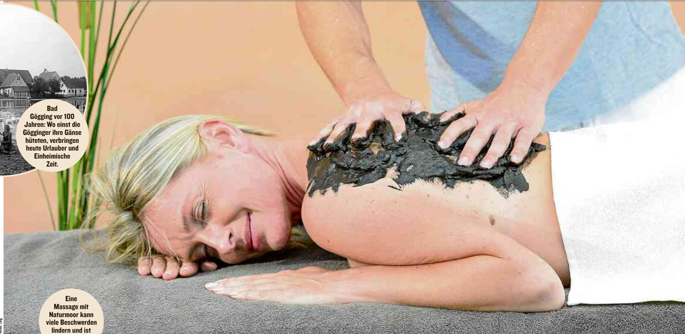
Eine Massage mit Naturmoor kann viele Beschwerden lindern und ist entspannend.